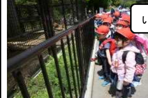
いろんな動物を見たよ