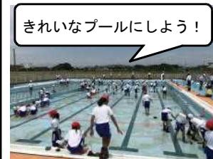
きれいなプールにしよう！