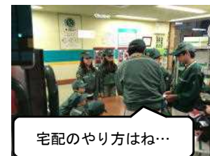
宅配のやり方はね…