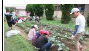
みんなで落ち葉拾いをして、 校庭をきれいにしました