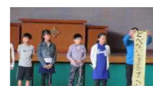
スポーツ委員が長縄の コツ等を発表しました