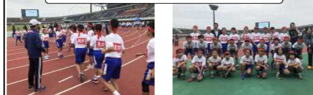
4日 陸上フェスティバル