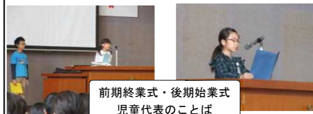
前期終業式・後期始業式 児童代表のこぼ