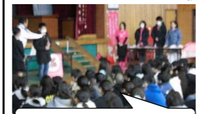
がん体験者から命の大切さを学びました