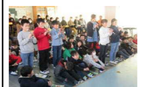
今年、最後の参観日をはがらったよ！