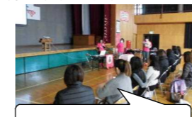
保護者対象の講話もありました