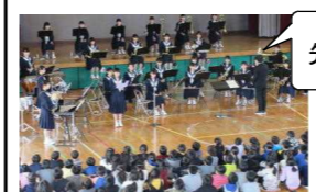
先輩方の演奏は上手だね