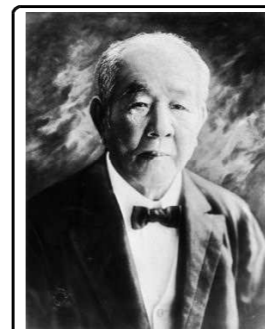
渋沢栄一（実業家） [1840 ~ 1931]

「近代日本経済の父」といわれ、新1万円札の顔となる、渋沢栄一氏は、深谷市の農家の家に生まれ、第一国立銀行や各種の会社の設立に参画し、実業界の指導的役割を果たした方です。その渋沢栄一さんの名言の一つに「夢七訓」があります。