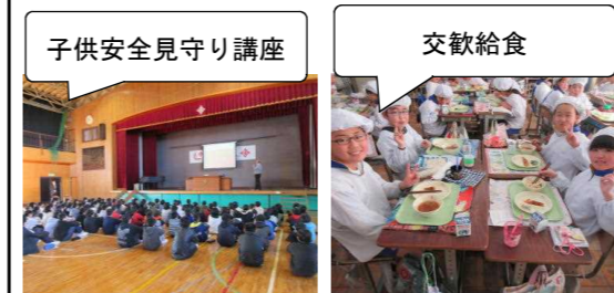
子供安全見守り講座