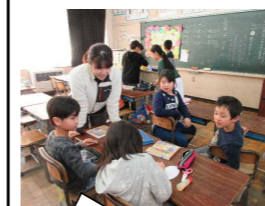
ながいっ子タイム