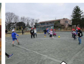
ながいっ子タイム