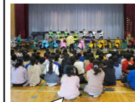
音楽鑑賞会 (妻沼東中吹奏楽部)