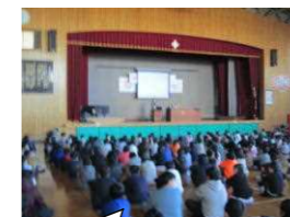
子供安全見守り講座