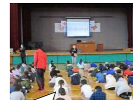
算数オリンピック