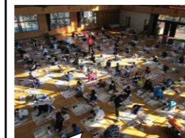
書きぞめ選手選考会