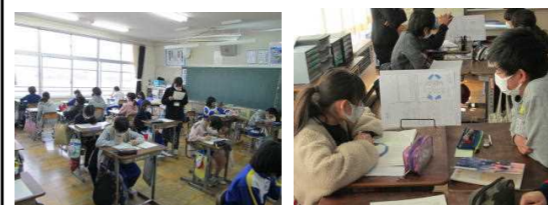
市小5検証テスト 6年：国語研究授業