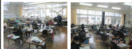
1年～4年校内「教育に関する3つの達成目標」効果の確認テスト