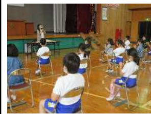
3年・リコーダー講習会