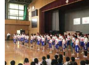
陸上フェスティバル激励会