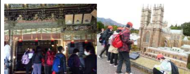
6年・日光へ修学旅行