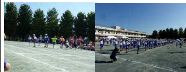
みんなで力を合わせがんばった運動会