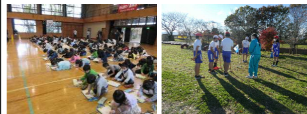
算数オリンピック