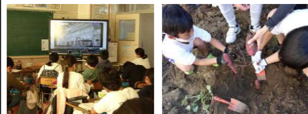
5年・オンライン 社会科見学