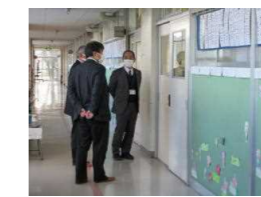
学校運営協議会委員による授業視察