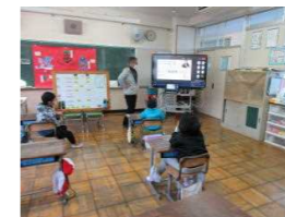
オンライン全校朝会