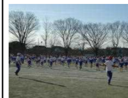
スポーツタイム短縄跳び