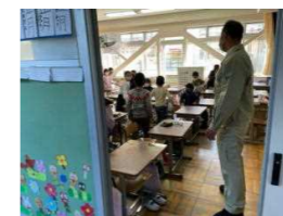
不審者想定避難訓練