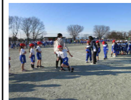
スポーツタイム長縄跳び