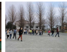
不審者想定避難訓練