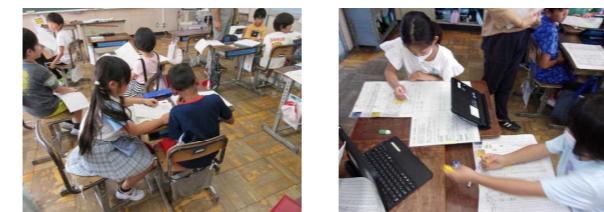
2年校内授業研究会