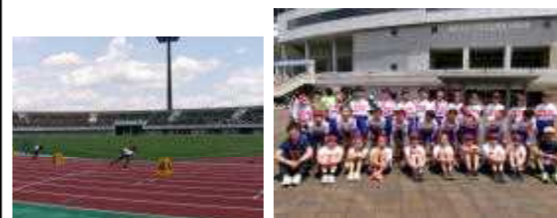
6年 陸上フェスティバル