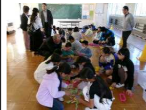
第2回桑小学校との交流会 1~4年生