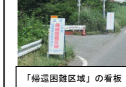
「帰還困難区域」の看板

学校でも、子供たちに体験を伴ったり理由づけたりさせながら正しい知識を身に付けさせたいと思います。