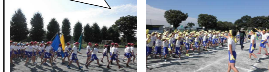
運動会の練習、がんばりました!