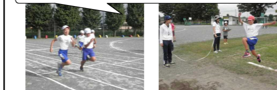
6年生は、放課後、陸上の練習にも取り組んでいます。